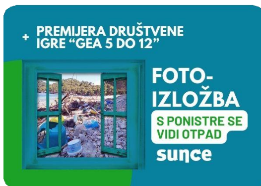
FOTO-IZLOŽBA NA DAN PLANETA ZEMLJE

U ponedjeljak, povodom Dana planeta Zemlje , otvaramo foto-izložbu "S ponistre se vidi otpad" , na kojoj ćete moći "uživati" u fotografijama koje prikazuju uistinu zabrinjavajuće stanje naše prirode.