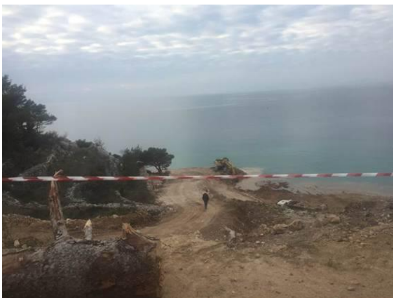
Nasipavanje u mjestu Drašnice, Općina Podgora