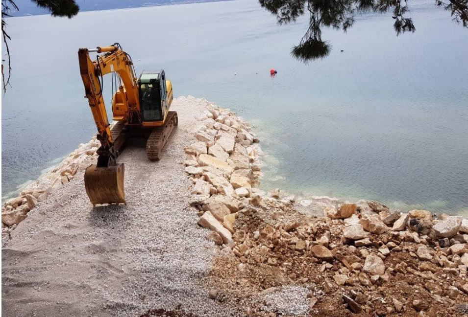
Nasipavanje u mjestu Bajnice Jesenice, općina Dugi Rat

Slike koje ste nam vi poslali u 2018.g.: