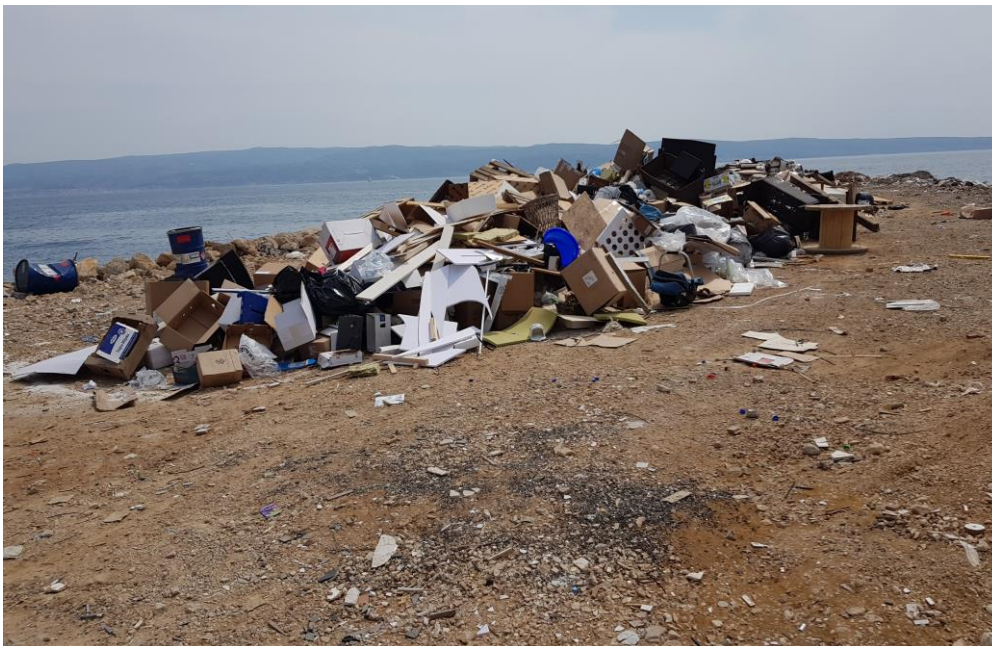
Otpad u luci Krilo Jesenice, općina Dugi Rat