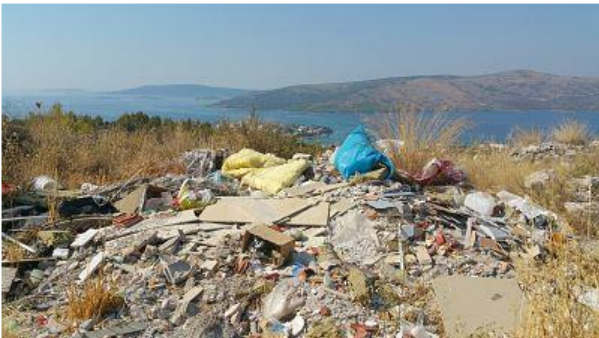
Fotografija 2: Divlje odlagalište otpada – okolica Seget Vranjica