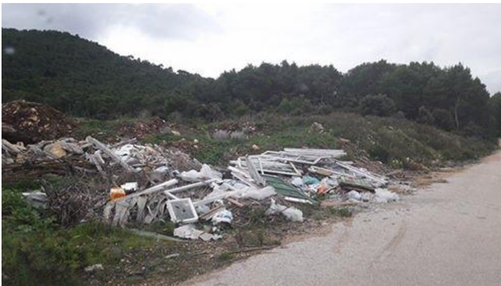
Fotografija 1: Divlje odlagalište otpada – otok Lastovo

Uz iskrene želje da nam iduća godina bude još zelenija od prethodne, srdačno Vas pozdravlja pravni tim Sunca!