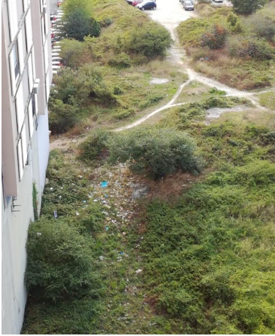
Fotografija 5: odlagalište komunalnog otpada uz stambenu zgradu – Trstenik, Split