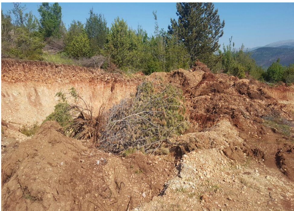
Fotografija 4: sječa šume – područje općine Muć